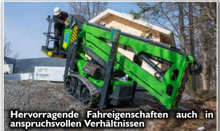
Hervorragende Fahreigenschaften auch in anspruchsvollen Verhältnissen