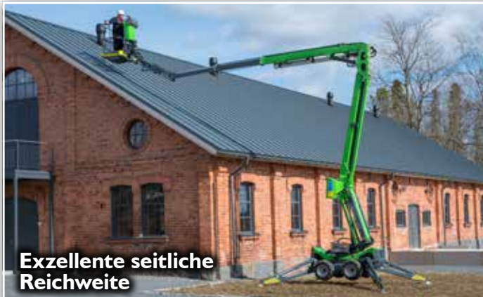
Exzellente seitliche Reichweite