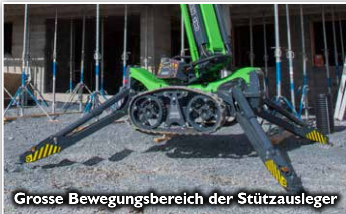
Grosse Bewegungsbereich der Stützausleger