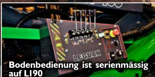
Bodenbedienung ist serienmässig auf L190