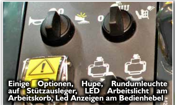
Einige Optionen, Hupe, Rundumleuchte auf Stützausleger, LED Arbeitslicht am Arbeitskorb, LED Anzeigen am Bedienelement