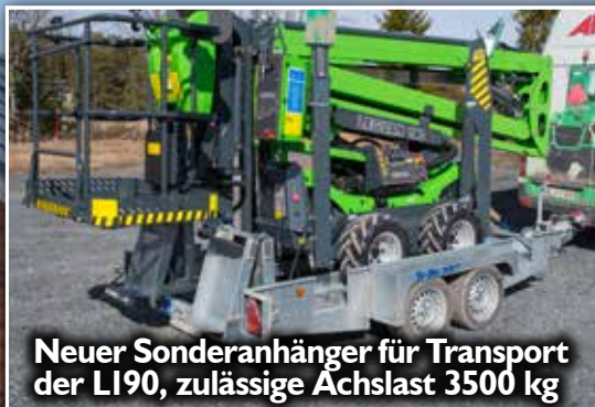
Neuer Sonderanhänger für Transport der L190, zulässige Achslast 3500 kg