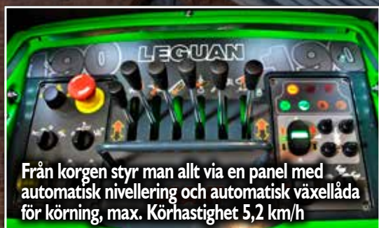
Från korgen styr man allt via en panel med automatisk nivellering och automatisk växellåda för körning, max. Körhastighet 5,2 km/h