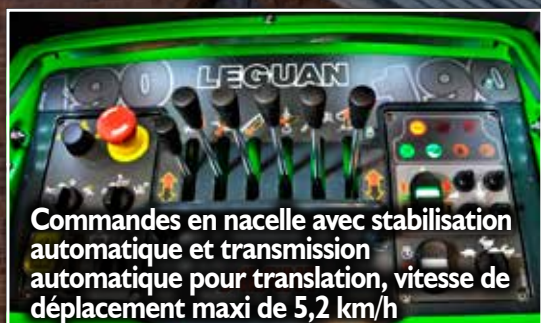
Commandes en nacelle avec stabilisation automatique et transmission automatique pour translation, vitesse de déplacement maxi de 5,2 km/h