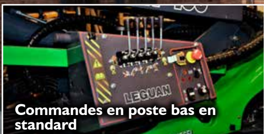
Commandes en poste bas en standard