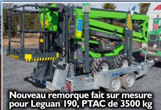
Nouveau remorque fait sur mesure pour Leguan 190, PTAC de 3500 kg