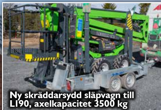
Ny skräddarsydd släpvagn till L190, axelkapacitet 3500 kg