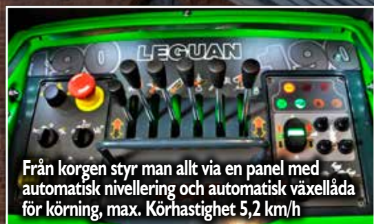
Från korgen styr man allt via en panel med automatisk nivellering och automatisk växellåda för körning, max. Körhastighet 5,2 km/h