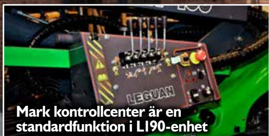
Mark kontrollcenter är en standardfunktion i L190-enhet